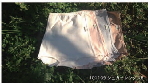
101109 シュガーレングスB