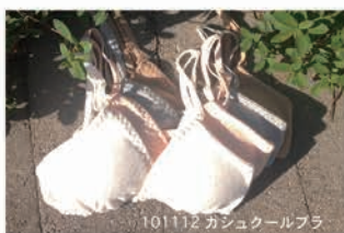
101112 ガッシュールブラ

all items size. S / M / L / LL quality. 綿 (オーガニックコットン) 100% color.