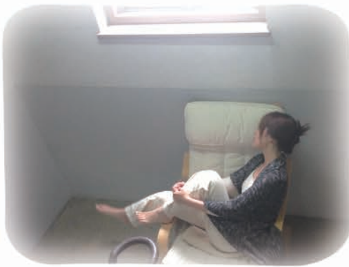
モデル着用:101104 フライスロングパンツ