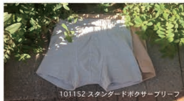
101152 スタンダードボクサーブリーフ